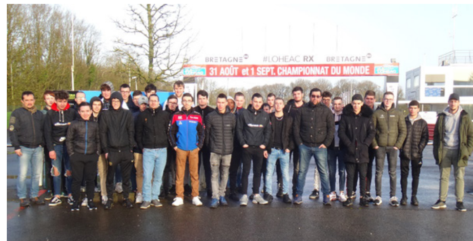
Sortie pédagogique à Lohéac – Filière Automobile