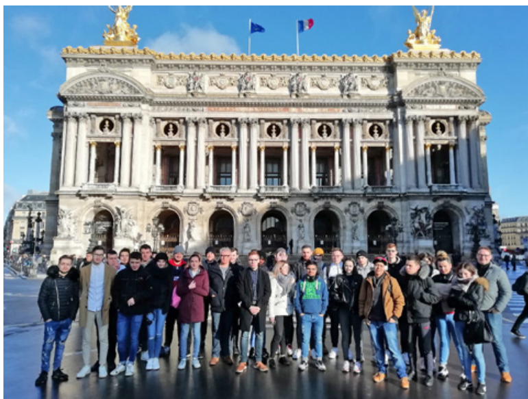
Sortie pédagogique Paris – Filière Alimentation

En respectant les locaux et le site, vous accomplissez un geste citoyen et vous faites preuve d'une réelle marque de respect à l'égard du personnel d'entretien qui chaque jour n'a comme objectif que de vous satisfaire !