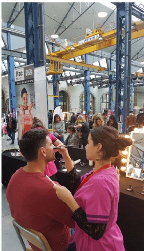
Fashion-Week – Capucins Brest – Filières Esthétique/Cosmétique et Coiffure

Horaires d'ouverture : de 8h30 à 17h30 du lundi au jeudi et 15h30 le vendredi.