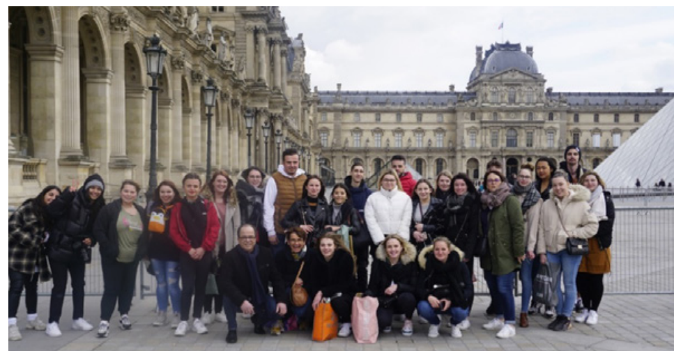
Sortie pédagogique Paris – Filière Commerce/Vente/Management

Les diplômes sont à retirer au service pédagogique de l'Ifac/Sup'ifac à partir du mois de novembre de l'année de l'examen.